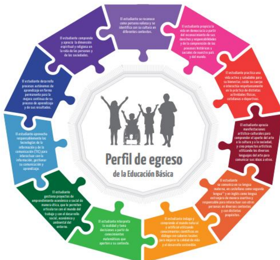
Figura 2. Perfil de egreso de la educación básica.

Por otro lado, (Mateus-Cifuentes et al. 2017), considera importante gestionar los recursos pedagógicos necesarios con la finalidad de promover un estudiante con pensamiento de aceptación a la diversidad de sus compañeros, esto involucra la posibilidad de articular relaciones basadas en la alteridad educativa. En este sentido, “la escuela con alta convivencia escolar y alta cultura inclusiva presentaba relaciones humanas cohesionadas, claridad de roles y funciones y su actual foco era de carácter pedagógico” (Valdés-Morales et al. 2019, p. 187). En razón de lo planteado, se contribuye en promover la adquisición del perfil de egreso en educación básica presentado por el Minedu. (2016).